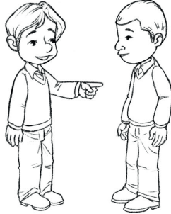
tú / usted